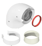
Отвод промежуточный коаксиальный, 60/100