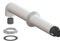
Комплект дымохода коаксиальный 1 метр, 80/125