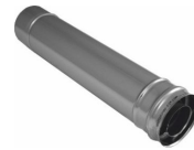
Удлинитель коаксиальный 60/100 для котлов UNO