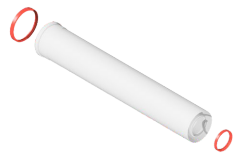
Удлинитель дымохода 1 метр, 60/100