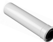
Удлинитель дымохода 1 метр, 80/125