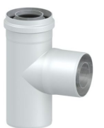
Конденсатосборник Т-образный, 60/100