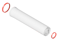
Удлинитель дымохода 0,5 метра, 60/100