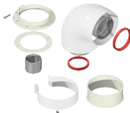
Отвод котловой коаксиальный, 60/100