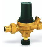
Клапан подпиточный Alimat ALD Watts (Германия)