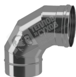
Отвод моно 90° ОМ-Р