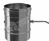
Шибер моно ШМ(М)-Р