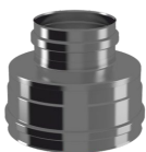
Конус термо КТ-Р с хомутом AISI 444, 0,5 мм, до 200°C.