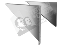
Крепление основное ККО 650