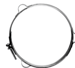
Хомут под растяжку Ferrum