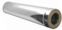
Труба термо L1000 (1 м) ТТ-Р с хомутом AISI 444, 0,5 мм, до 200°C.