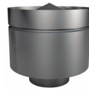
Дефлектор ДМ-Р AISI 444, 0,5 мм, до 200°C.