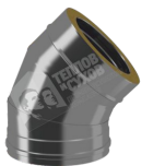
Отвод термо 45° ОТ-РО с хомутом AISI 444, 0,5 мм, до 200°C.