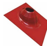
Проходник для крыш угловой №2, окрашенный 203-280 мм Ferrum