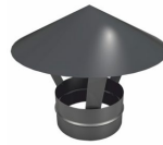
Зонт ЗМ-Р AISI 304, 0,5 мм, до 700°C.