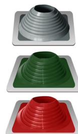
Уплотнитель кровельный №8 силикон 178-330 мм