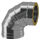
Отвод термо 90° ОТ-РО с хомутом AISI 444, 0,5 мм, до 200°C.