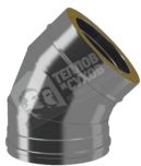
Отвод термо 45° ОТ-РО с хомутом